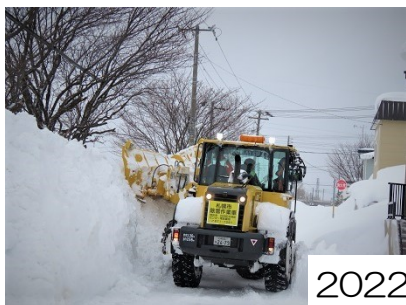
2022年2月22日札幌市除雪作業