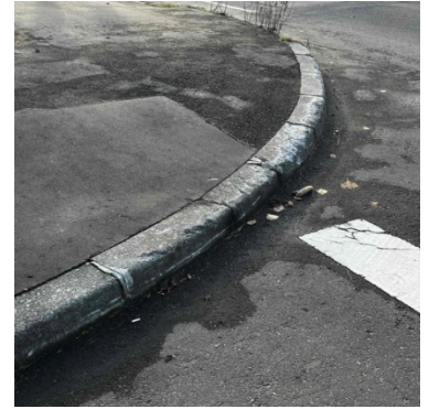
[改修工事前の縁石]

対象となる交差点では順次改修工事が行われ、工事中は住民の皆さんには多少の不便をおかけすることもあると思いますが、工事にご協力をお願いいたします。