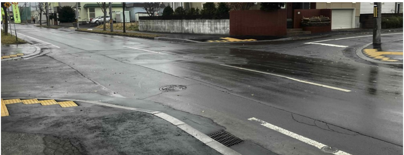
[改修工事後の交差点（川下4条3丁3番 東川下公園西側交差点）]